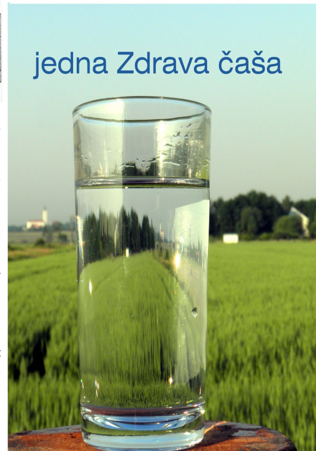
Pogon za preradu vode Moslavine d.o.o. u Ravniku

Prilikom plaćanja računa internet bankarstvom preporuča se oprez kako bi se izbjegle greške i plaćanje računa nekom drugom. Događa se da račun Eko Moslavine potrošači uplate na žiro račun Moslavine d.o.o.